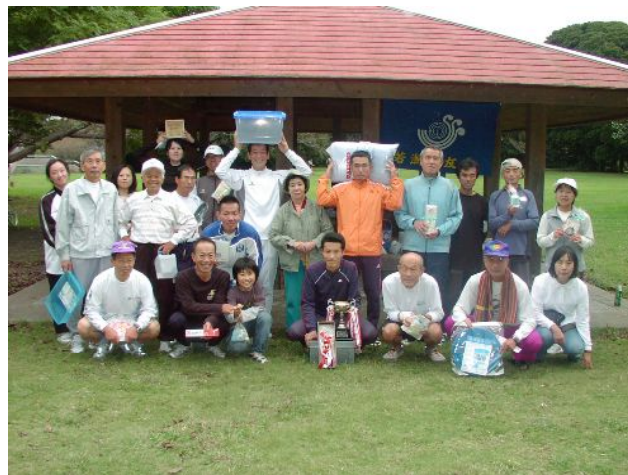
参加したみなさん